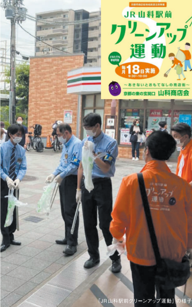
「JR山科駅前クリーンアップ運動」の様子。

そこで、SDGsにも繋がる地域の貢献活動として、駅前の清掃活動「JR山科駅前クリーンアップ運動」を令和4年3月より開始しました。毎月18日の午前9時30分から、JR山科駅、京都シティ開発(株)に加えて、地域の皆様も自由にご参加ください、JR山科駅前の清掃活動に取り組んでいます。この活動がSDGs活動をするきっかけとなり、より多くの方がSDGsに目